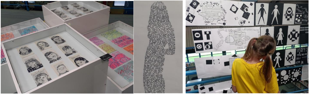
Fig. 3, 4 e 5 – “PIENO VUOTO: una mostra pARTEcipata”