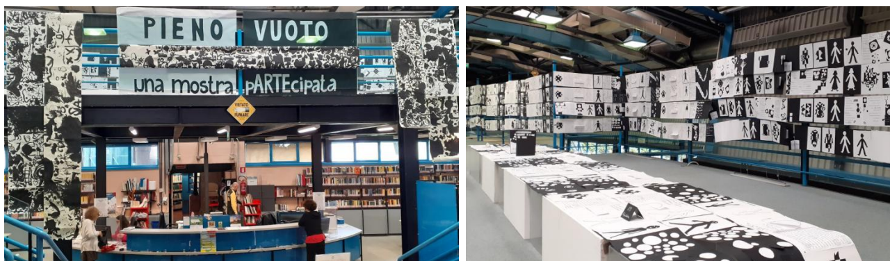
Fig. 1 e 2 – "PIENO VUOTO: una mostra pARTEcipata"