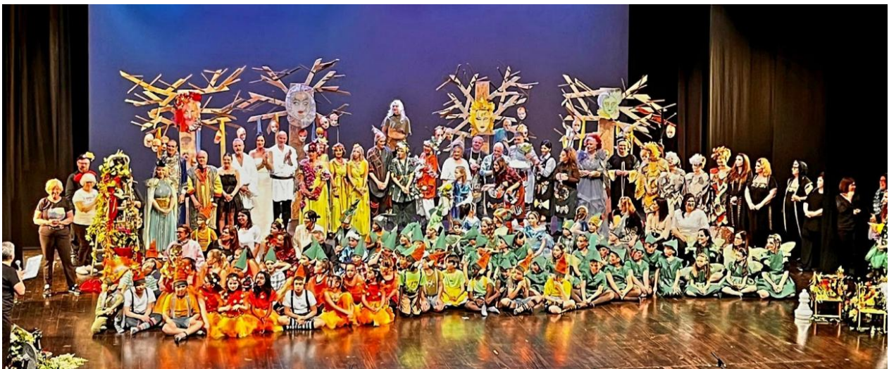
Fig. 6 – “Sogno di una notte di mezza estate”