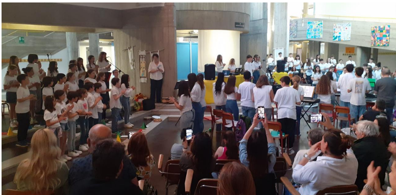
Fig. 9 – Un momento di “Colonne sonore in libertà”