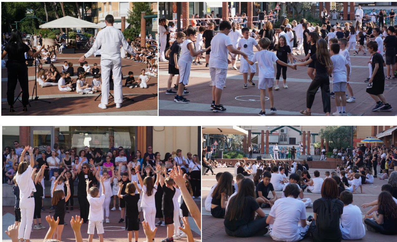
Fig. 15, 16, 17, 18 – Alcuni momenti dello spettacolo di sabato 27 Maggio nella piazza adiacente il Mercato coperto di Cattolica: “PIENO VUOTO, una storia pARTEcipata”