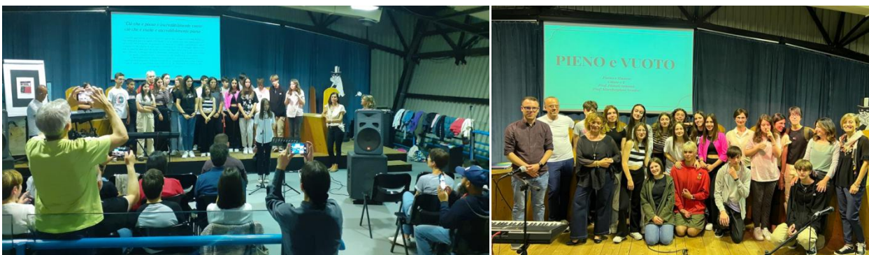
Fig. 7 e 8 – Letture sonore pARTEcipate